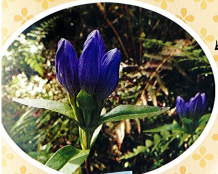
エゾリンドウ (9月上旬~10月上旬)